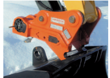
Löffelaufnahme mit A-Lock compact