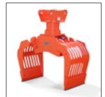
SG 0.5 bis 2.0 mit Drehmotor