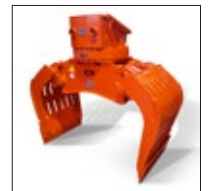
SG 2.3 bis 6.0 mit Drehkranz