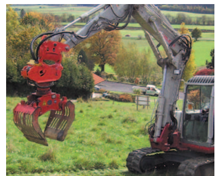
Oilmaxx mit Schwenkmotor