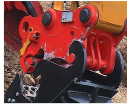
Oilmaxx mit Tiltator

Schwimmend gelagerte Trägerplatte für präzises Kuppeln