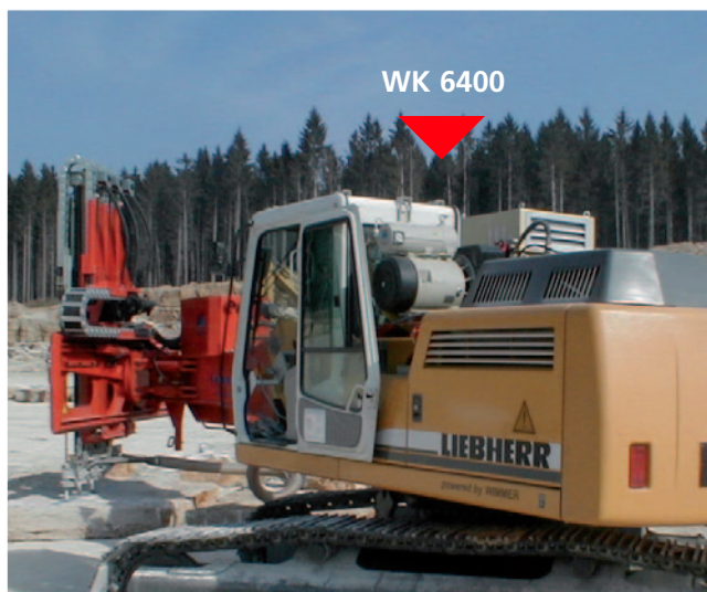
Im Einsatz mit Jura Luna 3.HEX1

Abmessungen: 1150x580x700 mm (LxBxH) Bagger Druckbegrenzung: 200 bar