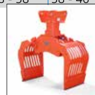
SG 0.5 à 2.0 avec rotateur intégré