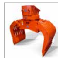
SG 2.3 à 6.0 avec couronne de rotation