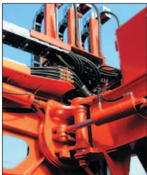
90° schwenkbar, Option 2 x 30° drehen