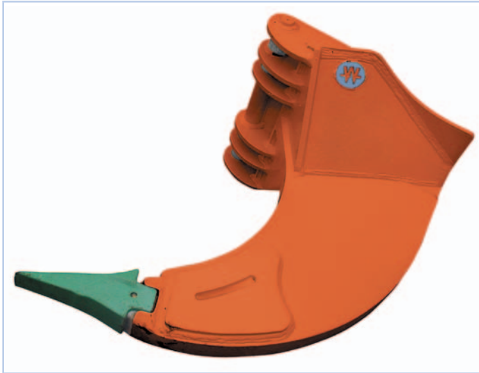
Reißzahn XHD für harte Einsatzbedingungen aus WHD 450 Sonderverschleißstahl, mit speziellem Esco Ripper-Zahn (ED mit Super V-Zahn)