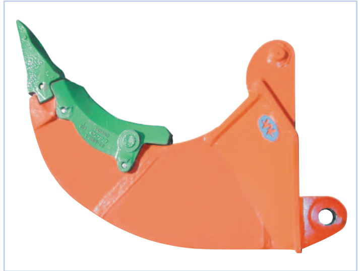
Reißzahn XXHD für extreme Einsatzbedingungen aus WHD 450 Sonderverschleißstahl, wechselbarer Esco Schenkelschutz und Zahn