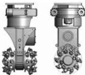
Option: hydraulisch endlos drehbar

Erforderliche Hydraulikausstattung: 1 x Druckleitung 1 x Tankleitung 1 x Leckölleitung