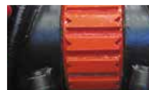
Hardox-Panzer schützt das Getriebe

Erforderliche Hydraulikausstattung: 1 x Druckleitung 1 x Tankleitung 1 x Leckölleitung