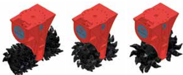
Beispiele für verschiedene Trommelversionen

* abhängig von Trommelversion, ** Gewicht ohne Adapterplatte