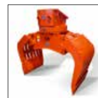
SG 2.3 bis 6.0 mit Drehkranz