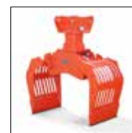
SG 0.5 bis 2.0 mit Drehmotor