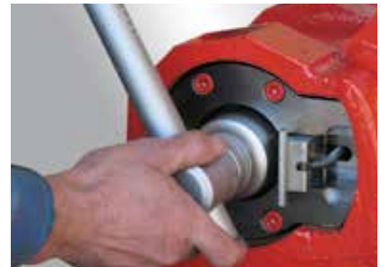
Verriegelungsbolzen mit 1 1/2 Umdrehungen öffnen