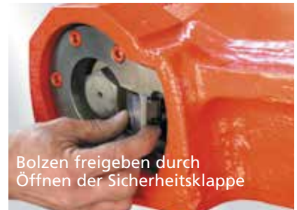
Bolzen freigeben durch Öffnen der Sicherheitsklappe

Bedienung der A-Lock mech Compact (Kl. 3, 3C)