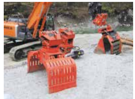
Arbeitsstunden für 8 versch. Werkzeuge können erfasst werden