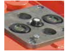
Kupplungen am Werkzeug