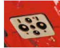
Kupplungen am Schnellwechsler

Volle Funktion auch bei Minustemperaturen (bis -20° C)