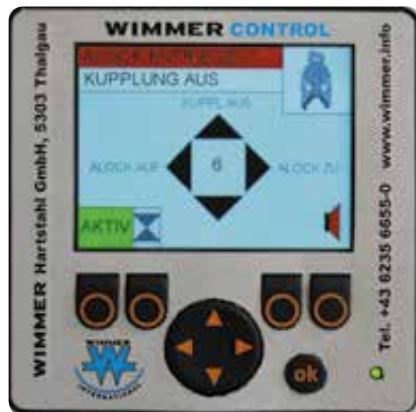
Oilmatic-Box mit akustischer Verriegelungskontrolle