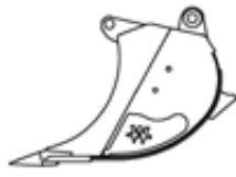
Fels Ideal XHD-Modell mit erhöhtem Eindringvermögen