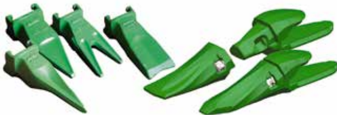
Je nach Einsatz verschiedene Zahnformen möglich