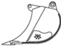
Fels Geschwungen Standardlöffel ab 600 mm Schnittbreite