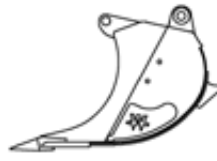
Steinleger Bewährte XHDBauform für Felsarbeiten