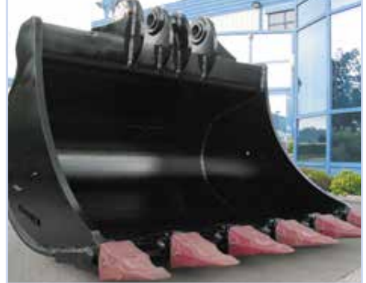
Standard-Zahnsystem Esco Super V, andere Zahnsysteme auf Kundenwunsch