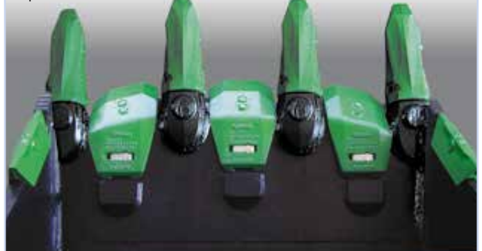
zusätzlicher Verschleißschutz, optional für XHD-Modelle

WIMMER Hartstahl GmbH & Co KG und WIMMER Felstechnik GmbH Industriestraße 3, A-5303 Thalgau, AUSTRIA, Tel. +43 (0)6235 6655-0, Fax DW-18