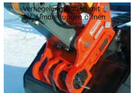
Verriegelungsbolzen mit 1 1/2 Umdrehungen öffnen