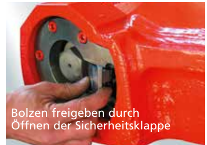
Bolzen freigeben durch Öffnen der Sicherheitsklappe