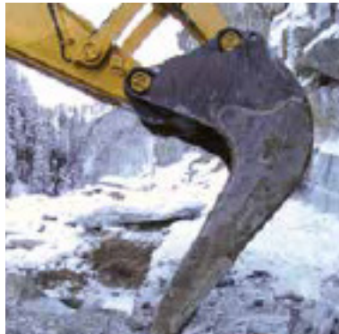
Version spéciale du godet de pose d'encrochements