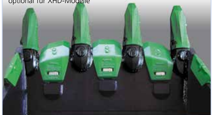
zusätzlicher Verschleißschutz, optional für XHD-Modelle

WIMMER Hartstahl GmbH & Co KG und WIMMER Felstechnik GmbH Industriestraße 3, A-5303 Thalgau, AUSTRIA, Tel. +43 (0)6235 6655-0, Fax DW-18