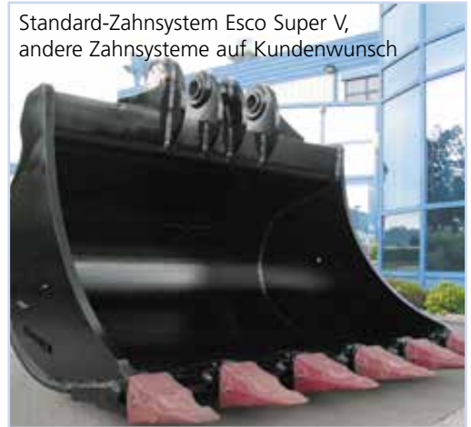
Standard-Zahnsystem esco Super V, andere Zahnsysteme auf Kundenwunsch