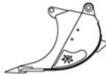
Steinleger Bewährte XHDBauform für Felsarbeiten