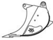
Fels Ideal XHD-Modell mit erhöhtem Eindringvermögen