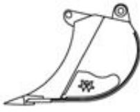
Fels Geschwungen Standardlöffel ab 600 mm Schnittbreite