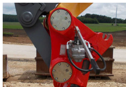
Betätigung mittels Handpumpe

Safety-Taster mit optischer und akustischer Warnung in der Fahrerkabine.