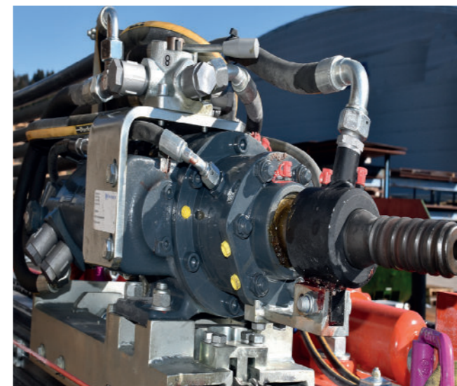
Eurodrill WHD 1002 Hammer