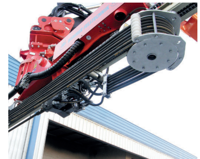
Saubere Schlauchführung über den Schlauchroller