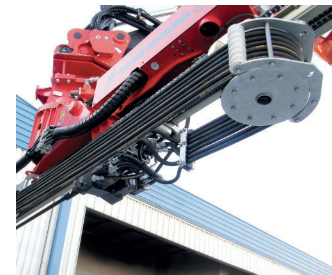
Enrouleur de flexible