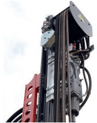
Enrouleur de flexible