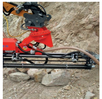
Chargeur des barres quintuple