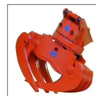
OCT 2.3 - 6.0 avec couronne de