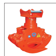
OCT 1.0 - 2.0 avec rotateur intégré